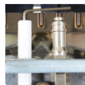
ODS Sistema de seguridad por ausencia de oxígeno.

Para efectos de instalación por favor verifique el manual de usuario. Especificaciones sujetas a cambios sin previo aviso*.