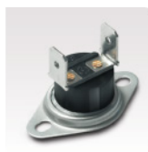
Bimetálico Sistema de seguridad por sobrecalentamiento del agua.